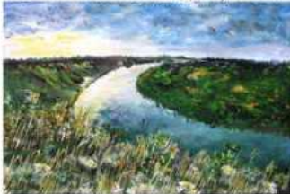
Нікіта Жувак сел. Ставки, м. Лиман, Донецька обл.