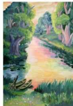
Нікіта Маляр, 15 років м. Південне, Харківська обл.