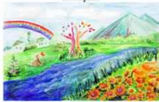
Слизавета Панат м. Привілля, Луганська область