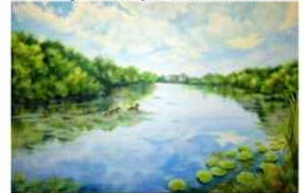
Анастасія Бурда м. Слов'янськ, Донецька область