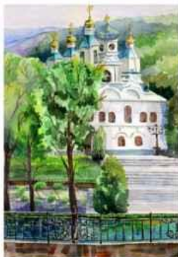
Стефанія Логвінова м. Лисичанськ, Луганська обл.