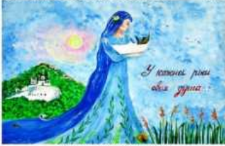
Анастасія Дашивець с. Новоселівка, Донецька область