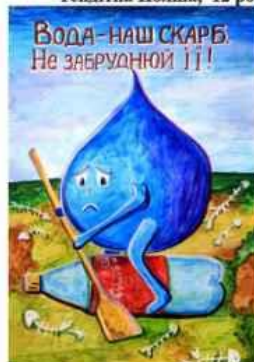
Слизавета Панайт м. Привілля, Луганська обл.