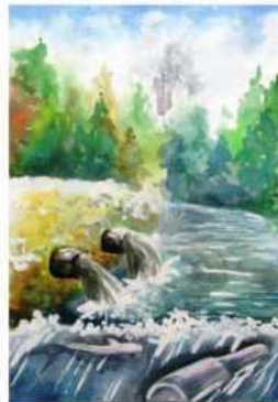
Марія Градінар м. Северодонецьк, Луганська обл. смт. Петропавлівка, Луганська обл.