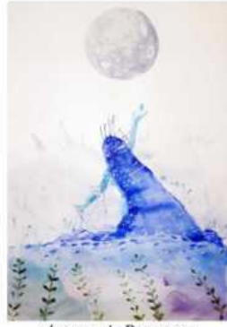
Анастасія Ругаленко м. Харків