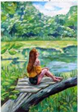
Валерія Рогожкіна м. Лисичанськ, Луганська обл.