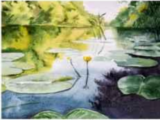
Масалітін Микита м. Харків