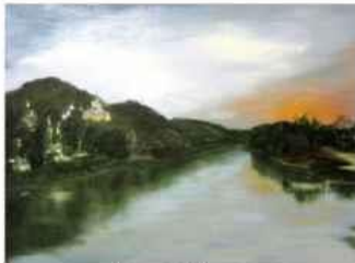
Дмитро Макуха м. Слов'янськ, Донецька область