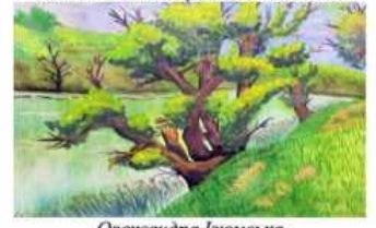
Олександра Ізюмська м. Лисичанськ, Луганська область