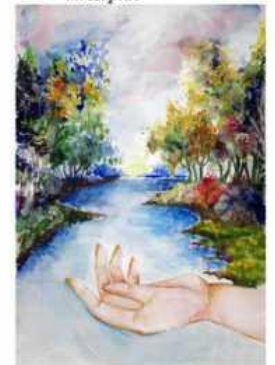
Альбіна Бречко м. Часів Яр, Донецька обл.