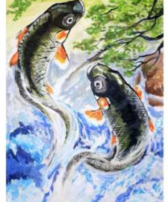
Анастасія Ругаленко м. Харків