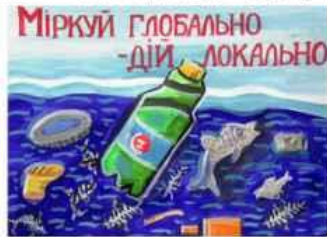
Міркуй глобально дію локально Кирило Духан м. Привілля, Луганська область