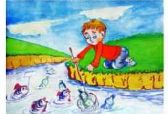
Евеліна Пеліпенко сел. Ставки, м. Лиман, Донецька обл.