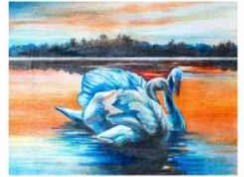
Гнатюк Альона м. Лисичанськ, Луганська обл.