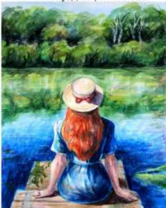
Настасія Позтавська м. Лисичанськ, Луганська область