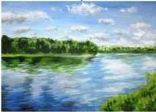
Данило Дахно м. Харків