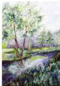
Альбіна Матвєєва м. Лисичанськ, Луганська обл.