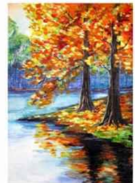
Маргарита Рєшєва м. Харків