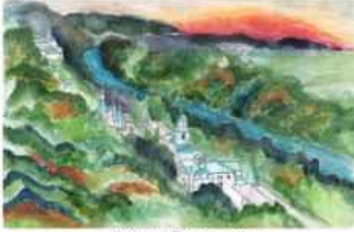
Тайсія Савицька м. Харків