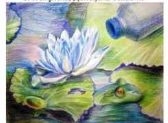
Нікіта Маляр, 15 років м. Південне, Харківська обл.