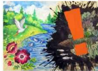
Овсій Кирило м. Харків