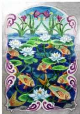
Юліана Машкіна м. Південне, Харківська обл.